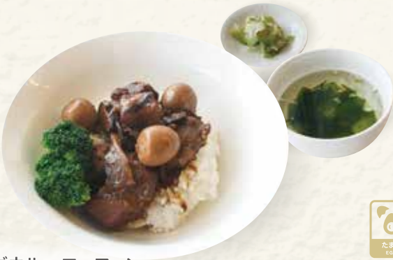
シャングウルローファン 香菇魯肉飯 (しいたけいっぱいルーローハン)