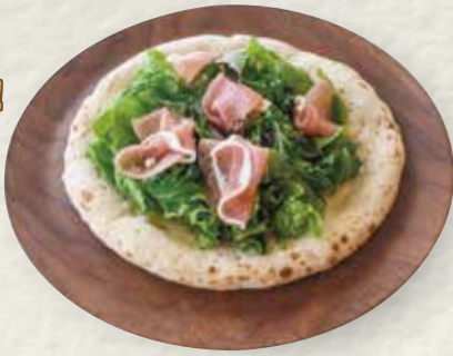
生ハムサラダピザ (レモンソース)