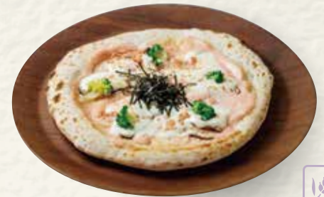
虎杖浜産たらこピザ (豆乳マヨソース)