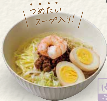
タンツォーメン 担仔麺 (ませ麺)