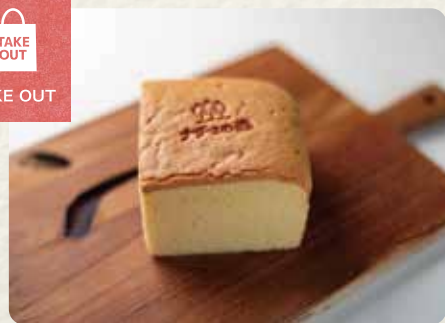
台湾カステラ プレーン ¥700