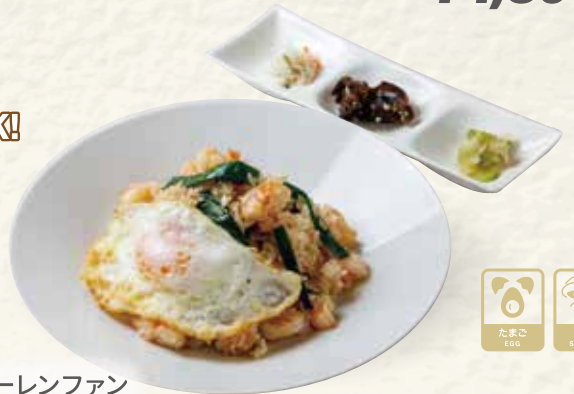
シャレンファン 蝦仁飯 (エビ飯)