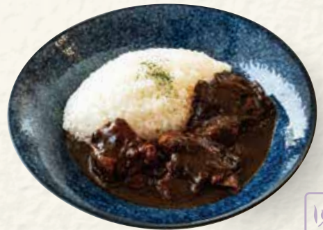
ヘイカーリー 黒咖喱 (野菜ゴロゴロ黒カレー)