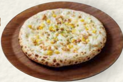
ポテマヨピザ (ポテトサラダ)