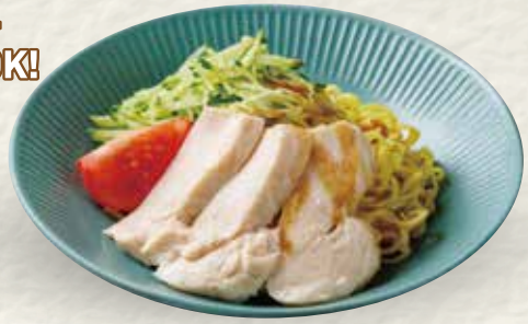
リャンメン 冷麺 (冷やし麺)