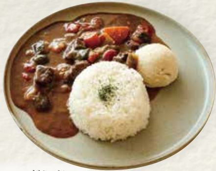
エズルーロードンツァイ 蝦夷鹿肉炖菜 (鹿肉のシチュー)