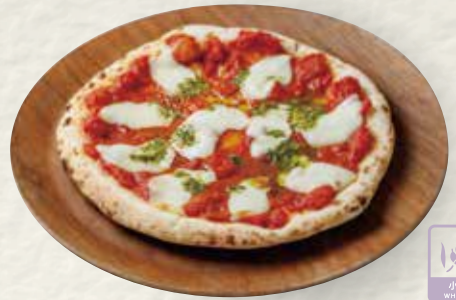
ジェノベーゼピザ (トマトソース)