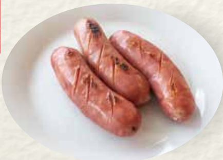
台湾ソーセージ 1本 ¥480